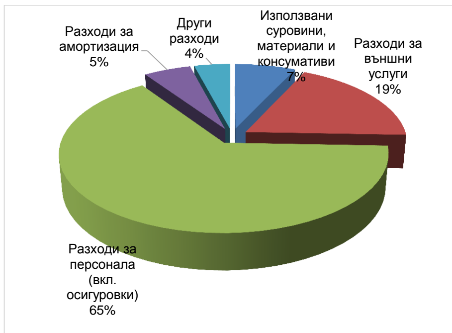
Графика № 3. Структура на разходите по икономически елементи за 2015 г.

През отчетната 2015 г. се запазва традиционната структура на разходите по икономически елементи. Преобладават разходите, свързани с персонала (възнаграждения и осигуровки) 65%, което е отражение на ролята на човешкия фактор в сферата на високотехнологичните информационни услуги. Структурата на разходите по икономически елементи е показана на Графика № 3 :