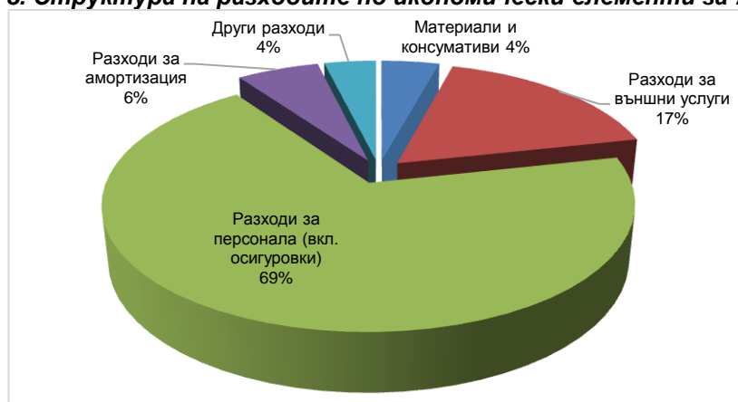
Графика № 3. Структура на разходите по икономически елементи за 2016 г.

През отчетната 2016 г. се запазва традиционната структура на разходите по икономически елементи. Преобладават разходите, свързани с персонала (възнаграждения и осигуровки) 69%, което е отражение на ролята на човешкия фактор в сферата на високотехнологичните информационни услуги. Структурата на разходите по икономически елементи е показана на Графика № 3 :