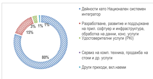
Графика № 1.2. ИО – Структура на приходи по услуги за периода 01.01. – 30.09.2023 г.